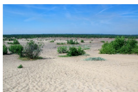
Rysunek 3. (Obertová, 2021: 7)

Polacy mogą być dumni z różnorodności przyrody. Znajdują się tu i góry, i morze, i jeziora. Są tu także wulkany, pustynia, geoparki, parki krajobrazowe i narodowe, mnóstwo rezerwatów, wodospadów, jaskiń, rzek, kotlin... Polska to naprawdę różnorodny i zielony kraj. Piękno polskiej przyrody może nie robi aż takiego wrażenia na samych Polakach, ale zdumiewa zagranicznych turystów.